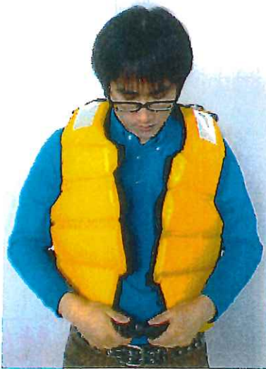
①救命衣に両腕を通し、バックルを止めて下さい。