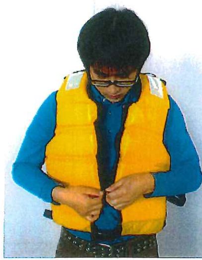
②スライドファスナを閉じて下さい。

藤倉航装株式会社 東京都品川区荏原2丁目4番46号 TEL 03-3785-2108