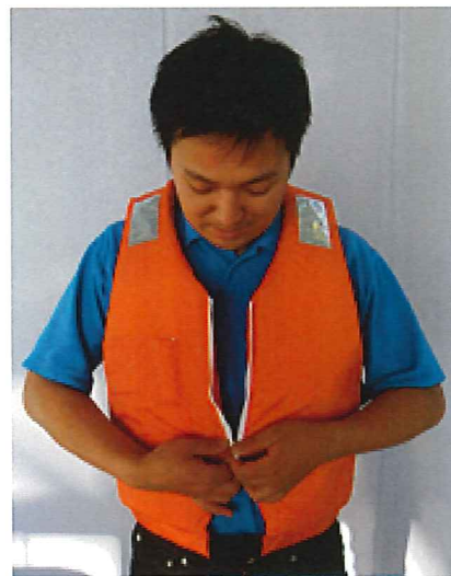
②スライドファスナを閉じて下さい。