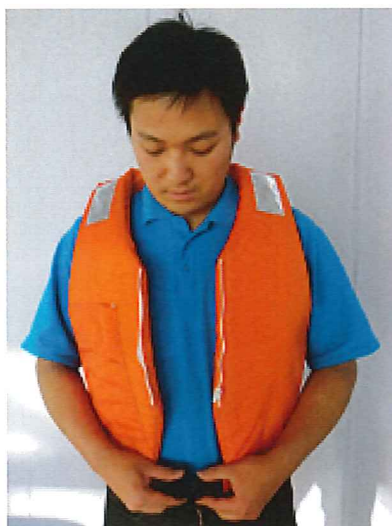
①救命衣に両腕を通し、バックルを止めて下さい。